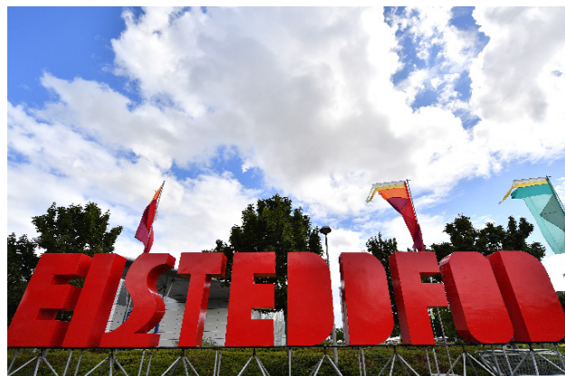
Eisteddfod Genedlaethol 2018, Caerdydd.