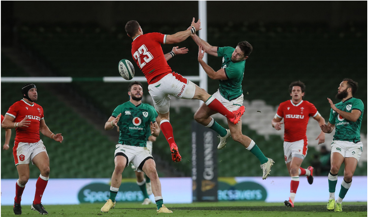
Hugo Keenan o Iwerddon a George North o Gymru yn cystadlu am y bêl yn yr awyr yn ystod cyfres Cwpan y Cenhedloedd ym mis Tachwedd 2020.