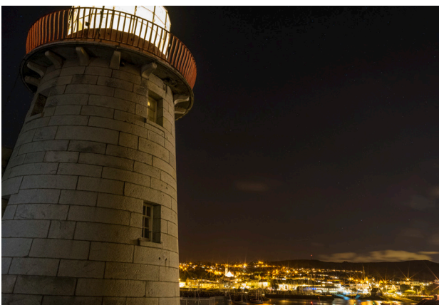
Mae goleudy Baily ar Howth Head yn edrych ar draws Môr Iwerddon tuag at Ynys Môn

Mae twristiaeth yn sector strategol allweddol a chanddo fanteision pwysig i ddatblygu rhanbarthol yn y ddwy economi, a hefyd mae'n darparu llawer o waith. Wrth i'r diwydiant twristiaeth geisio adfer ar ôl effaith COVID-19, bydd Iwerddon a Chymru yn gweithio gyda'i gilydd i rannu gwersi wrth ymateb i'r her hon.