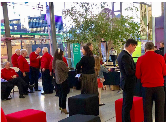
Aelodau o'r gymuned Gymreig yn Iwerddon yn ymgynnull yn EPIC Amgueddfa Ymfudo Iwerddon yn Nulyn.

Mae Cymru ac Iwerddon yn danbaid dros chwaraeon o bob math, o chwaraeon cymunedol llawr gwlad i chwaraeon elit ar lefel broffesiynol. Mae ein polisiau'n hyrwyddo'r arfer o gymryd rhan mewn chwaraeon, er lles unigolion a chymunedau. Mae'r adfywiad a welir yng Nghymru ar hyn o bryd yng nghlybiau'r Gymdeithas Athletaidd Wyddelig (GAA) yn arwydd pellach o'r hanes hir sydd gan gymunedau Gwyddelig yn y wlad.