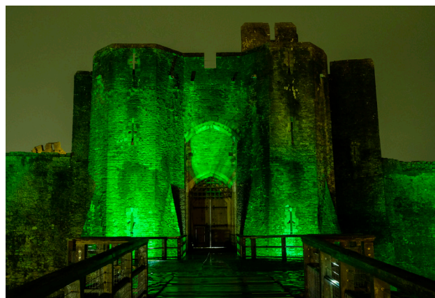
Troi Castell Caerfili yn wyrdd, Dydd Sant Padrig 2020.