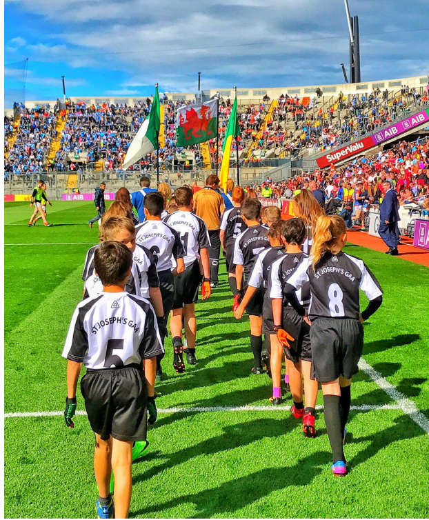
Tim GAA St Joseph Abertawe yn Croke Park.

Mae cysylltiadau rhwng pobl â'i gilydd wrth galon ein perthynas agos. O'r cyfnod Celtaidd, trwy'r cyfnod Normanaidd, y chwyldro diwydiannol, a hyd heddiw, mae teuluoedd ac unigolion wedi symud yn ôl a blaen rhwng Iwerddon a Chymru, ac o amgylch y byd, naill ai trwy ddewis neu o reidrwydd i geisio bywyd gwell.