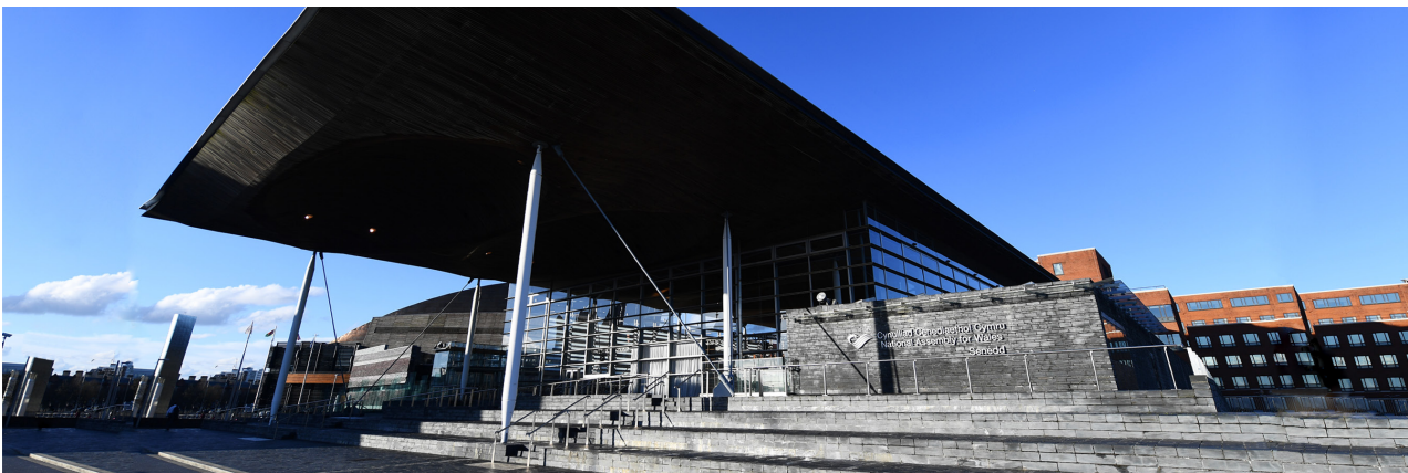
Senedd Cymru, Bae Caerdydd.

Er mwyn dwyn lleisiau'r holl sectorau ynghyd, yn 2021 byddwn yn lansio Fforwm Iwerddon-Cymru blynyddol fel ffordd newydd a phwysig o gynnal deialog a meithrin perthynas. Bydd y Fforwm yn cael ei gynnull gan Swyddfa Prif Gonswl Iwerddon yng Nghaerdydd a Swyddfa Llywodraeth Cymru yn Nulyn. Bydd themâu'r Fforwm cyntaf yn cael eu cytuno'n flynyddol, ac un o brif themâu'r fforwm gyntaf, ddiwedd 2021, fydd cynaliadwyedd ac adferiad gwyrdd, cyn Cynhadledd Newid Hinsawdd y Cenhedloedd Unedig (COP26) sy'n cael ei chynnal yn y DU.