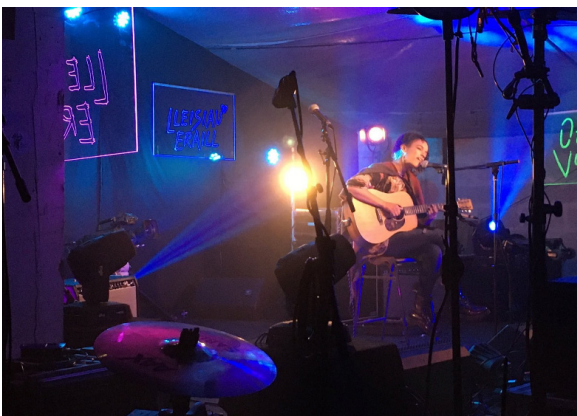
Other Voices yn Eglwys y Santes Fair, Ceredigion.

Rydym yn trysori'r amrywiaeth ieithyddol a diwylliannol yn yr ynysydd hyn, a gwyddom y gall y naill ddysgu gan y llall yng nghyswllt dwyieithrwydd a datblygiad polisi iaith.