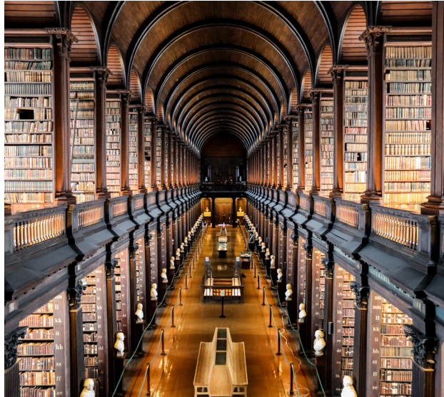
Yr Ystafell Hir yn yr Hen Lyfrgell, Coleg y Drindod Dilyn.

Ers cyfnod y mynachod, mae ysgolheigion wedi symud yn rheolaidd rhwng Cymru ac Iwerddon – traddodiad a adlewyrchir yn fwy diweddar yn yr arfer o gyfnewid myfyrwyr, disgyblion, ymchwilwyr, hyfforddeion ac academyddion rhwng sefydliadau Iwerddon a Chymru.