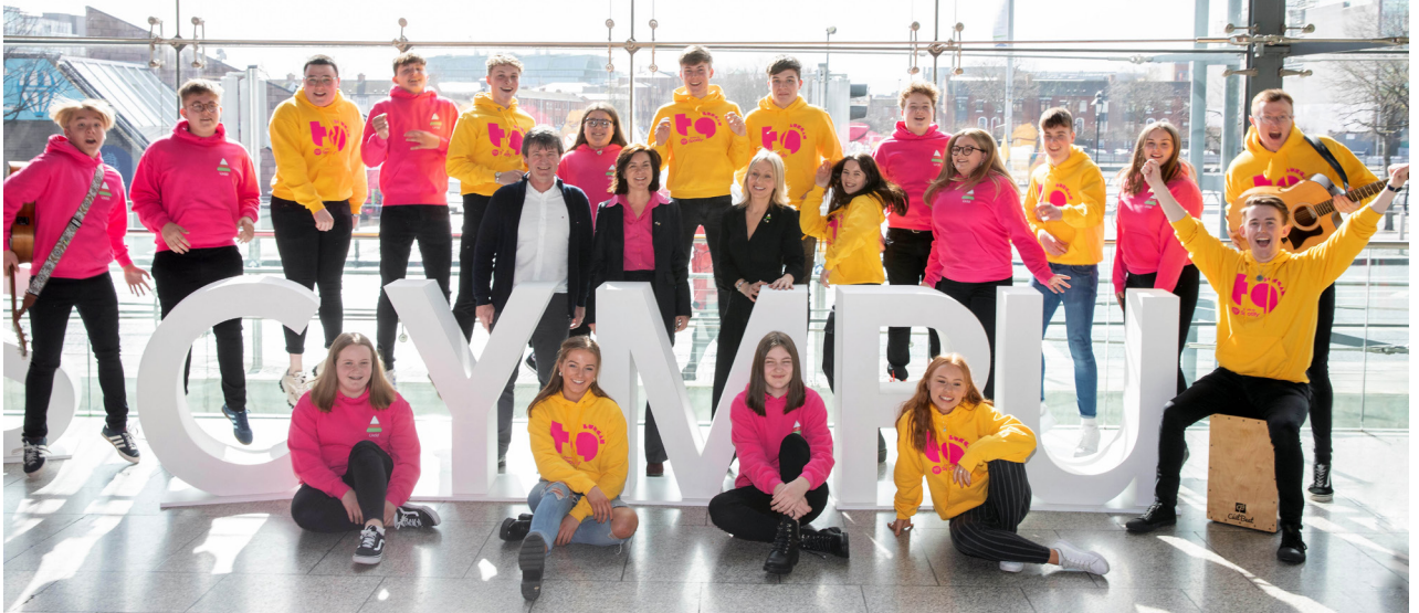
Aelodau o'r Urdd a TG Lurgan gyda'i gilydd yn lansiad eu partneriaeth ddwyieithog yn Nulyn.