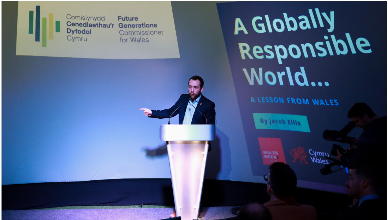
Trafodaeth bolisi ynghylch Deddf Llesiant Cenedlaethau'r Dyfodol Cymru yn Wythnos Cymru yn Nulyn yn 2020.