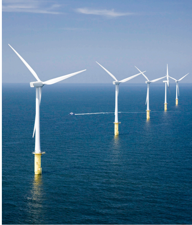
Fferm wynt North Hoyle ym Mhrestatyn oedd fferm wynt alltraeth gyntaf Cymru ym Môr Iwerddon.

Newid hinsawdd yw her fyd-eang ddiffiniol ein cyfnod, ac mae'r angen dybryd i gymryd camau yn safbwynt a gaiff ei rannu gan Iwerddon a Chymru. Byddwn yn blaenoriaethu camau gweithredu ar y cyd a fydd yn ategu datblygu cynaliadwy, trwy addasu i newid hinsawdd a lliniaru newid hinsawdd, twf gwyrdd, a phontio i economi carbon sero net ac economi gylchol. Credwn y gall gwneud ein priod economïau'n fwy gwyrdd sbarduno datblygiadau cymdeithasol ac economaidd a chynorthwyo i adfer ar ôl COVID-19, yn ogystal â chynnig cyfleoedd ar gyfer buddsoddi a thwf.