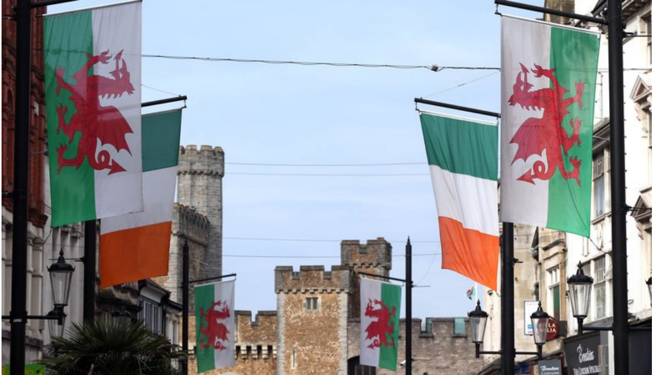
Baneri Iwerddon a Chymru yn strydoedd Caerdydd ar ddiwrnod gêm.

Yn ystod oes ein Cyd-ddatganiad ar gyfer 2021-25, byddwn yn hwyluso ac yn cefnogi cydweithio a fydd yn esgor ar ganlyniadau parhaus a chadarnhaol a all fod o fudd i'r ddwy wlad. Canolbwynt hyn fydd Fforwm Iwerddon-Cymru a fydd yn cael ei gynnull gan Swyddfa Prif Gonswl Iwerddon yng Nghaerdydd a swyddfa Llywodraeth Cymru yn Nulyn. Bydd y digwyddiad yn dod â rhanddeiliaid gwleidyddol, economaidd ac ehangach ynhyd, a bydd yn gyfle i feithrin perthynas a gwireddu potensial cyfleoedd yn awr ac yn y dyfodol.