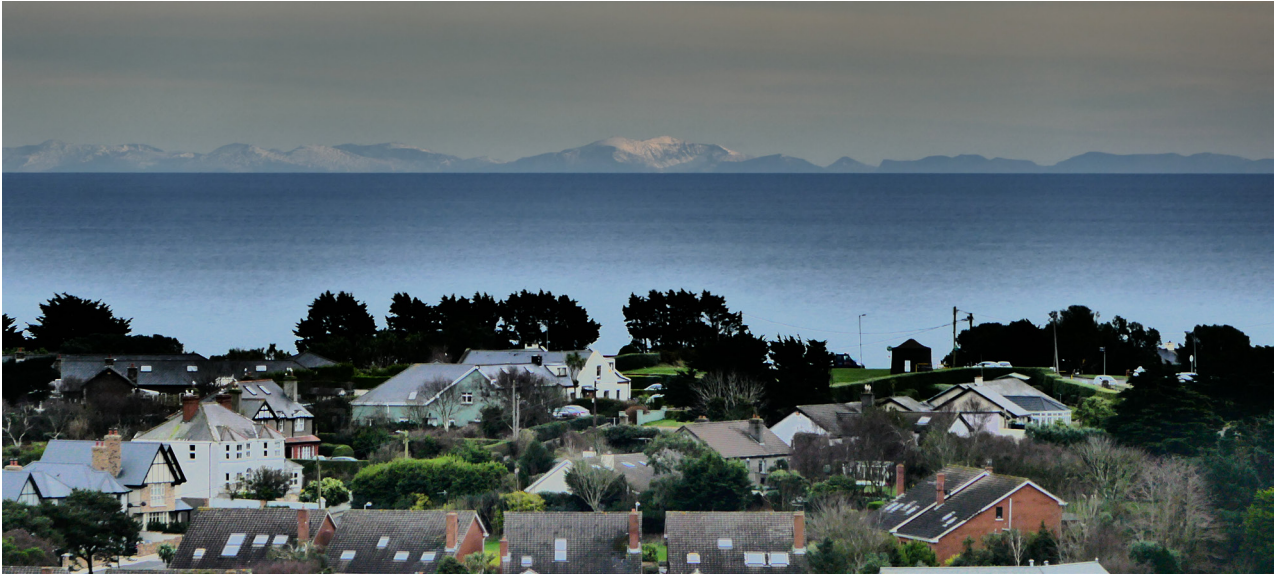
Yr Wyddfa o benrhyn Howth, Dilyn. © Niall O'Carroll