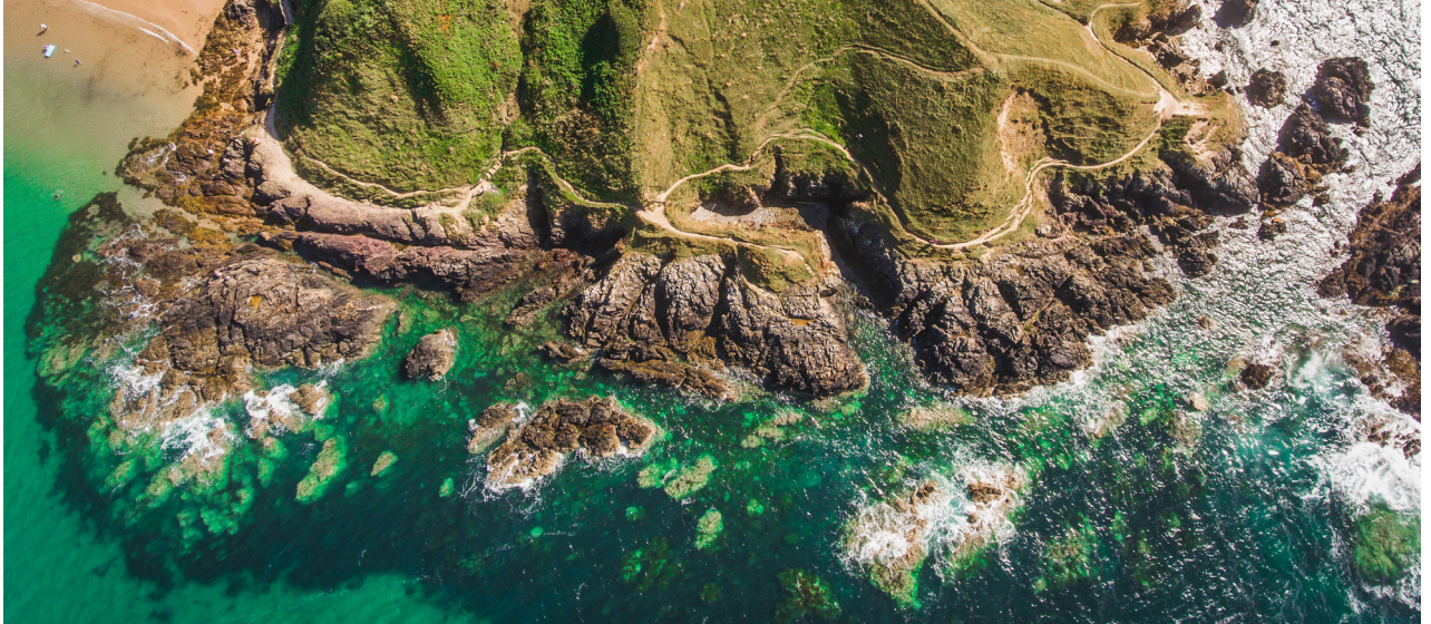
Mae Porthor yn Llŷn yn safle twristiaeth a chadwraeth amlwg, a dyma un o'r mannau agosaf at Iwerddon ar arfordir Cymru