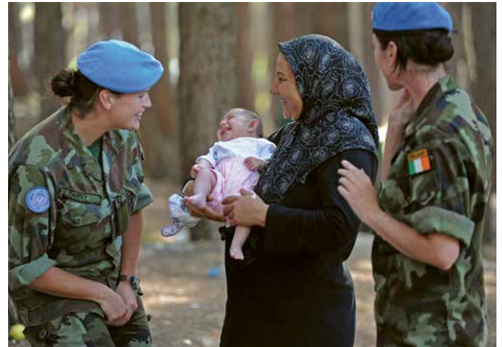
Tá Éire rannpháirteach i ngníomhaíochtaí coimeádta síochána na Náisiúin Aontaithe ar bhonn leanúnach ó 1958 i leith. Ar na saolta seo, cuireann Éire an méid is mó trúpaí in aghaidh an duine ar fáil do ghníomhaíochtaí coimeádta síochána na Náisiúin Aontaithe.

Is cuid lárnach an iarrthóireacht ar an gComhairle Slándála dár gclár oibre idirnáisiúnta agus den mheon atá againn mar oileán domhanda agus don ghealltanas a thugaimid nach mór dúinn maireachtáil ar scáth a chéile sa domhan idirspiléach atá againn ar na saolta seo.