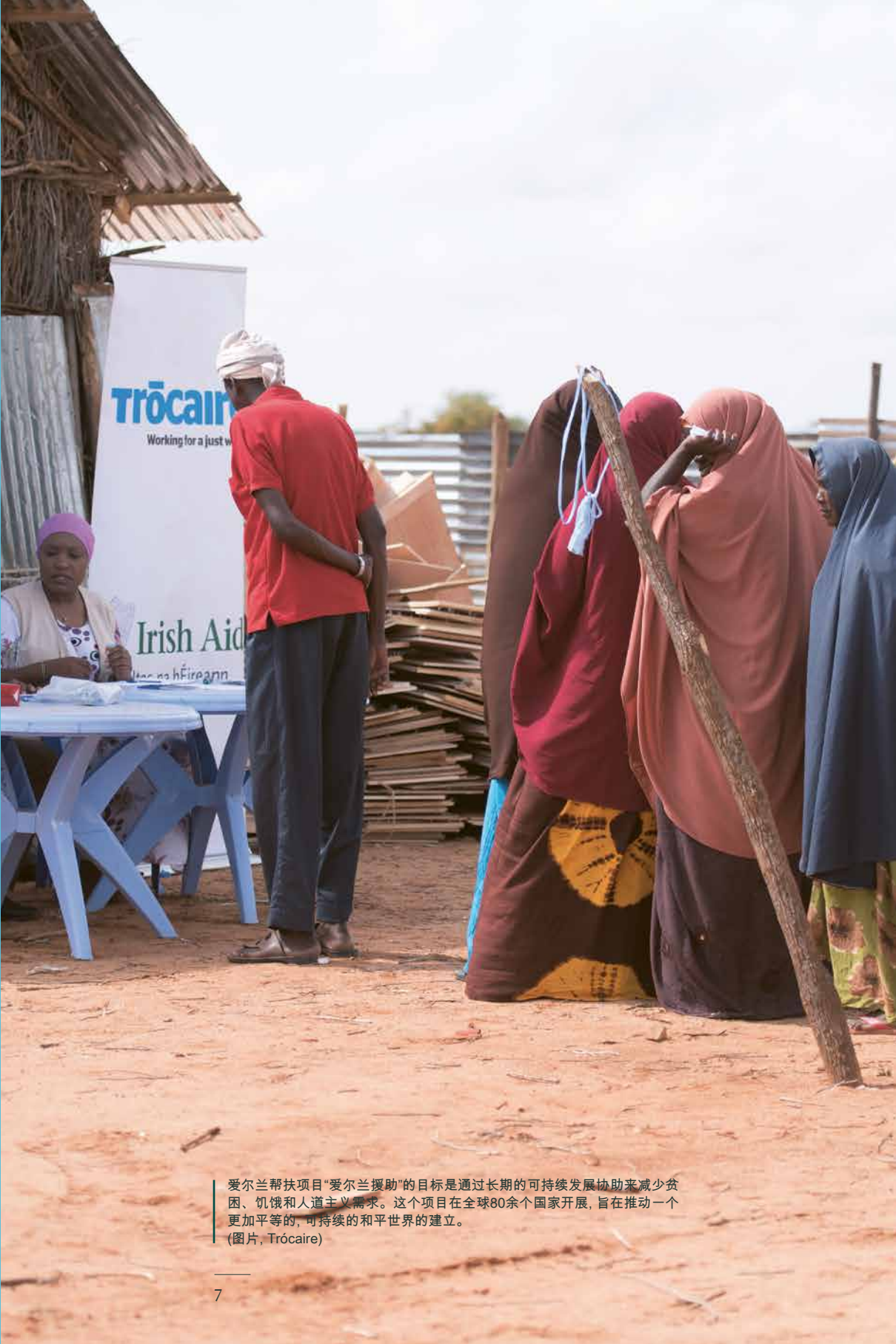
爱尔兰帮扶项目“爱尔兰援助”的目标是通过长期的可持续发展协助来减少贫困、饥饿和人道主义需求。这个项目在全球80余个国家开展，旨在推动一个更加平等的、可持续的和平世界的建立。