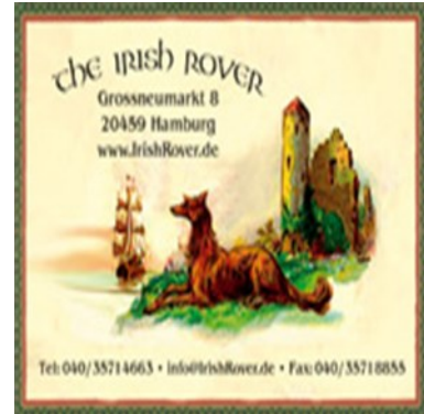
Irish Rover Pub

Start: 6 Februar 2017 um 18.30 (15 Einheiten á 60 Minuten)