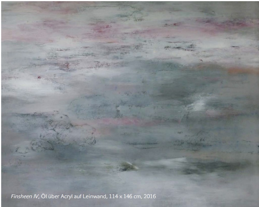
Finsheen IV , Öl über Acryl auf Leinwand, 114 x 146 cm, 2016